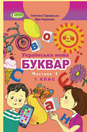
Ukrajinský slabikář. Slabikář pro ukrajinské prvňáčky, vydavatelství Heneza, Nová škola