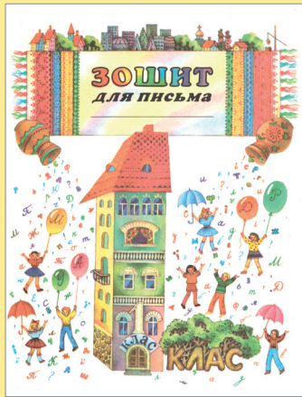
Pisanka pro první třídu, vydavatelství SVIT, Lvov, 2007

Ukrajinský jazyk je oficiálním jazykem druhého největšího evropského státu – Ukrajiny. Ukrajinštinu používá také menšina na Slovensku, v Polsku, v České republice nebo USA.