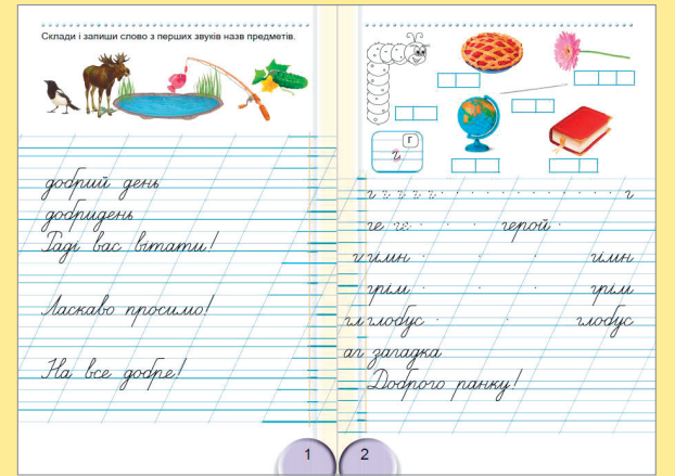
Ukrajinská písanka pro děti 1. třídy, vydavatelství Heneza

Ukrajinská abeceda se nazývá azbuka (azbukou se čte a píše):